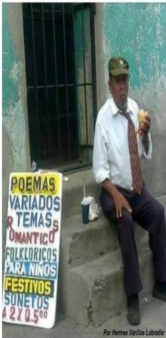
Por Hermes Varillas Labrador

A LO QUE LLEGA UNO CON ESTA CRISIS, CARAMBA!!!